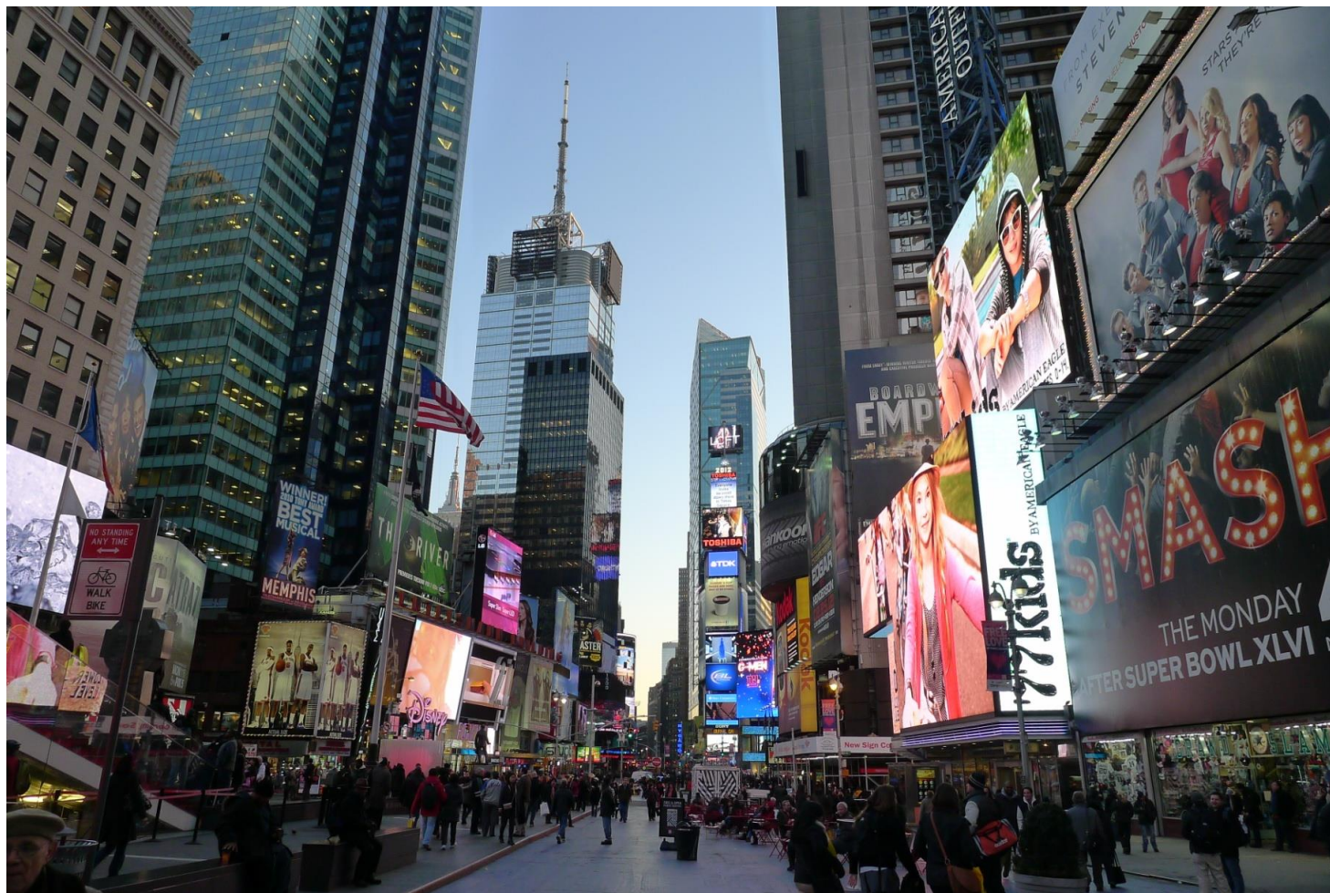
Times Square, New York, 2012

Filozofija dandanes res ni več univerzalna sinteza védnosti, še vedno pa je véliko »križišče« človeških misli in poti