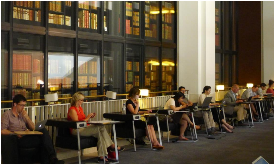
The British Library, London, 2013

Zaradi vseh teh, še zdaleč ne samo dobrih, ampak, žal, tudi zelo slabih strani interneta je treba s pedagoškega, etičnega in ne nazadnje tudi filozofskega vidika kritično premisliti, kakšna naj bo vloga interneta in nasploh digitalne tehnike v izobraževanju.