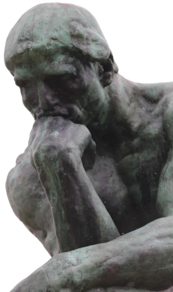
Auguste Rodin, Mislec , 1904